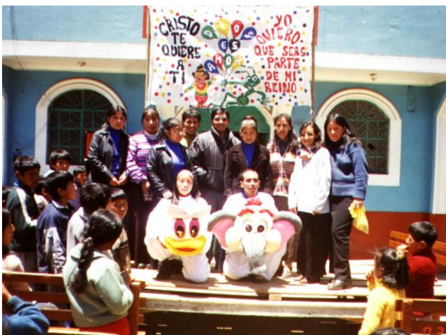
Actividad del Departamento de Escuela Dominical