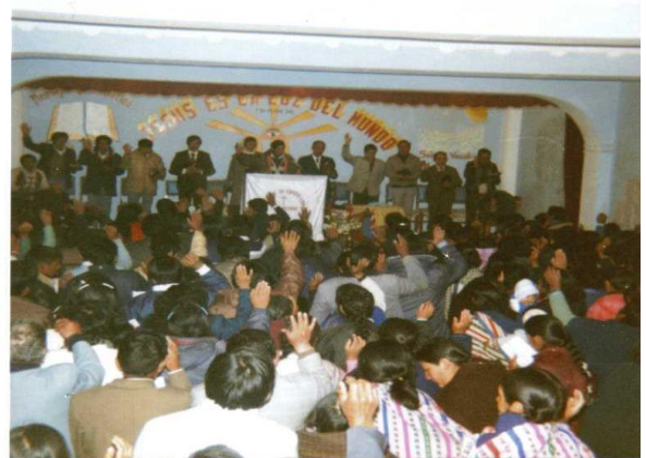
Culto Inauguración del Templo nuevo