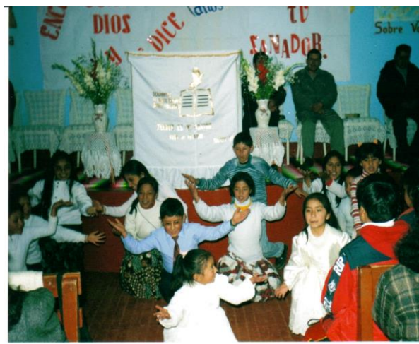
Coreografía de Niños