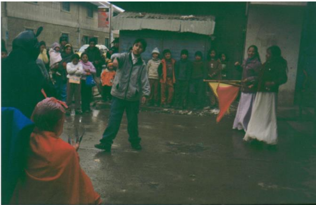
Adolescentes haciendo teatro frente a la Municipalidad